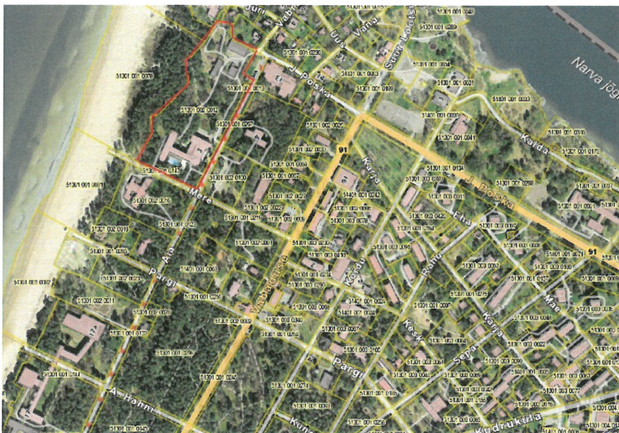
Joonis 1. Aia tn 3 kinnistu asukoht ja piirid

1.2 Planeeritava ala pindala on ca 30 317 m 2 .