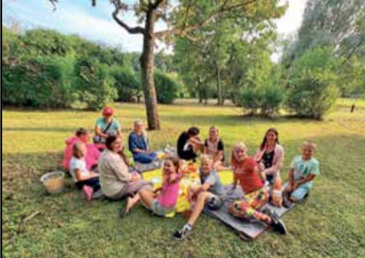
Sinimäe kooli õpilased piknikul.

Algklasside õpilased, vanemad ja õpetajad said üle pika aja taas kokku. Toimusid erinevad kaasahaaravad tegevused neljas erinevas punktis, mida juhendasid algklasside õpetajad. Oleme kindlad, et igaüks leidis endale meelepärast liikumis- ja mänguelamust. Õhtut alustati ühiselt eesti rahvamänguga „Kes aias, kes aias, mesilane aias...“. Nii vahva, kui kõik koos said ennast häälestada eelseisvale õppeaastale.