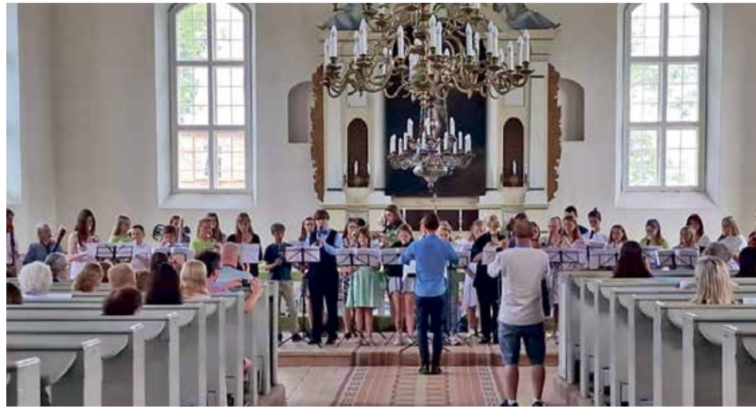
Plokklööpiansambli suvekooli kontsert Rõuge kirikus.

„Puhkustklassi õpilased ootavad juba kaheksandat korda kannatamatult juulikuud, mil Lõuna-Eestis Rõuge linnas „avab ukseid“