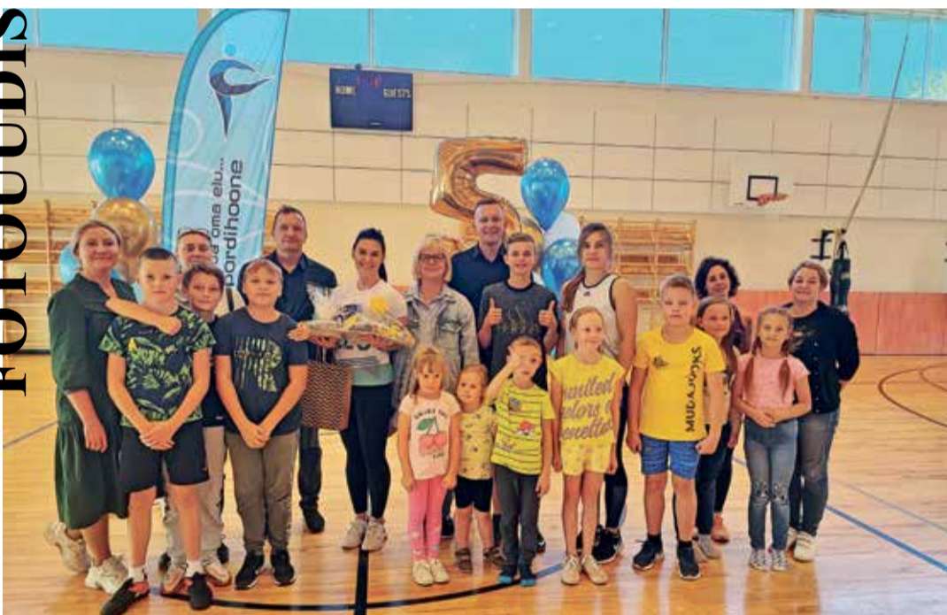
Juba viis aastat on Sinimäe spordihooned olnud sõbraks meie sporti hindavatele inimestele. Nii väikestele, kui ka suurtele.