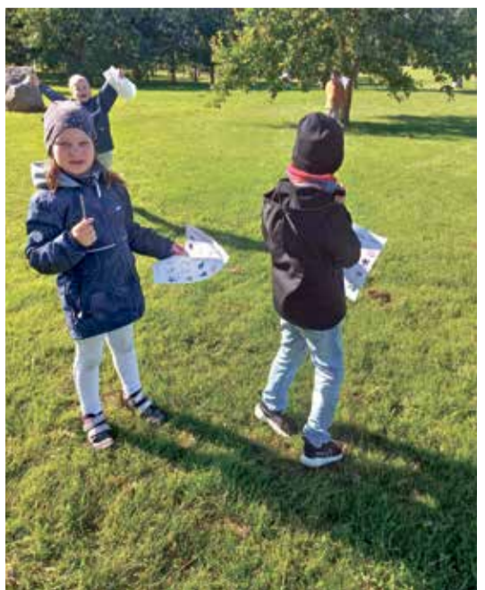
Sinimäe koolis on õues liikumine õpilastele huvitavaks tehtud.