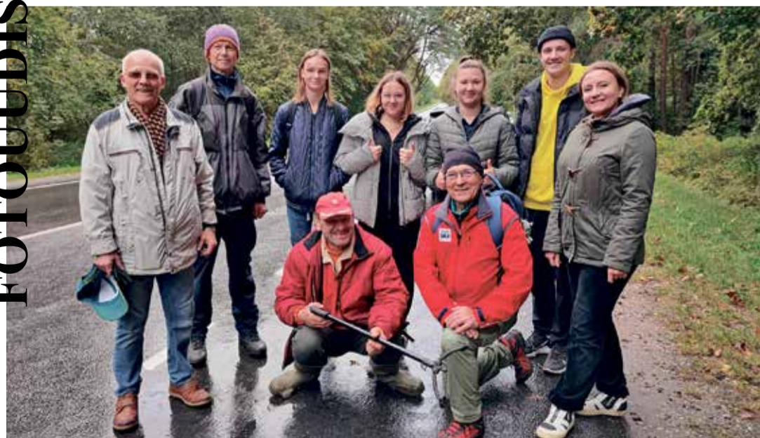
Maailmakoristuspäeval ei olnud sügisene ilm neile takistuseks, et suvist prahti metsa alt ja mere rannast prügikotti toppida.