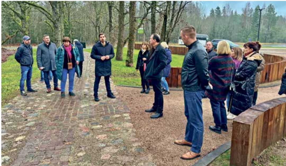
Знакомство с центром Mulgi Elamuskeskus.

Специалист по связям с общественностью волостной управы Тярва