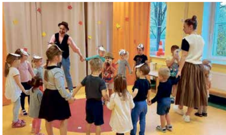
Мардисанды детского сада Вайвара.

Чем же еще можно удивить родителей? У нас есть чем. В детском саду Вайвара уже на протяжении многих лет дети учатся готовить. Под руководством наших учителей, дети учатся правильно мыть, взвешивать, резать овощи и фрукты. И с каждым разом блюда становятся все интереснее и разнообразнее. Салаты,