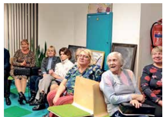
На презентацию книги пришло больше гостей, чем ожидалось.

Предприятие AS Narva-Jõesuu Kommunaal объявило тендер на расширение тренажерного зала спортивного комплекса Синимяэ с целью расширить площадь используемого в настоящее время зала и сделать его просторнее, поскольку сейчас пользование тренажерным залом ограничено. «Тренажерный зал используется всё чаще, и заинтересованных в последнее время так много, что людям просто не хватает там места. Мы решили, что объединим зал с находящимся на втором этаже коридором и откроем сторону игрового зала посредством новых больших окон», — сказал мэр Нарва-Йыэсуу Максим Ильин, добавив, что, помимо строительных работ, в тренажерный зал заказан новый спортивный инвентарь, отвечающий нуждам посетителей. ML