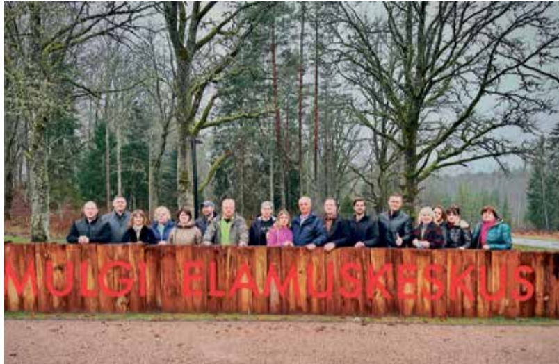
В Mulgi Elamuskeskus.

Затем гости направились обратно в город Тярва, где получили осмотреть центральную площадь и расположенный там эффектный парк