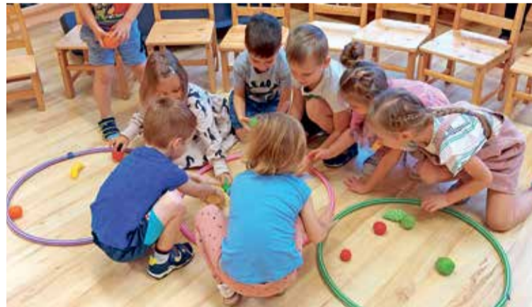
Малыши детского сада Карикакар.

Традиционно, каждое второе воскресенье ноября посвящено нашим папам и дедушкам. Чтобы показать свою любовь и уважение, каждая группа детского сада Карикакар мастерила подарки, готовила открытки и угощения. Дети учили стихи и песни о папах и дедушках, чтобы в нужный момент подобрать самые важные слова.