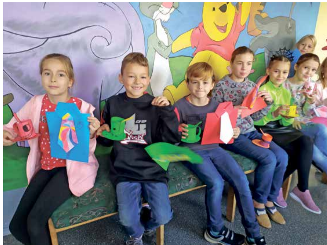
Подарки папам готовы.