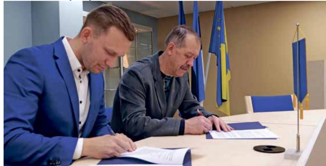
Подписание договора с представителем AS Vant.