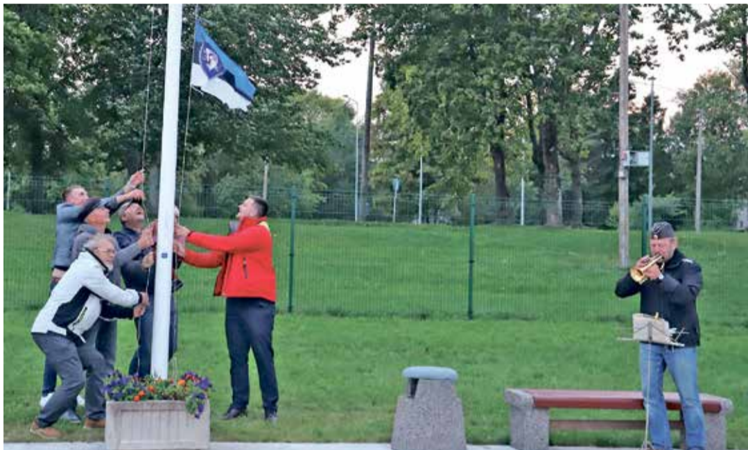
Новый флаг на мачте поднимается под звуки трубы.

Такие вымпелы будут украшать яхты членов яхтенного клуба.