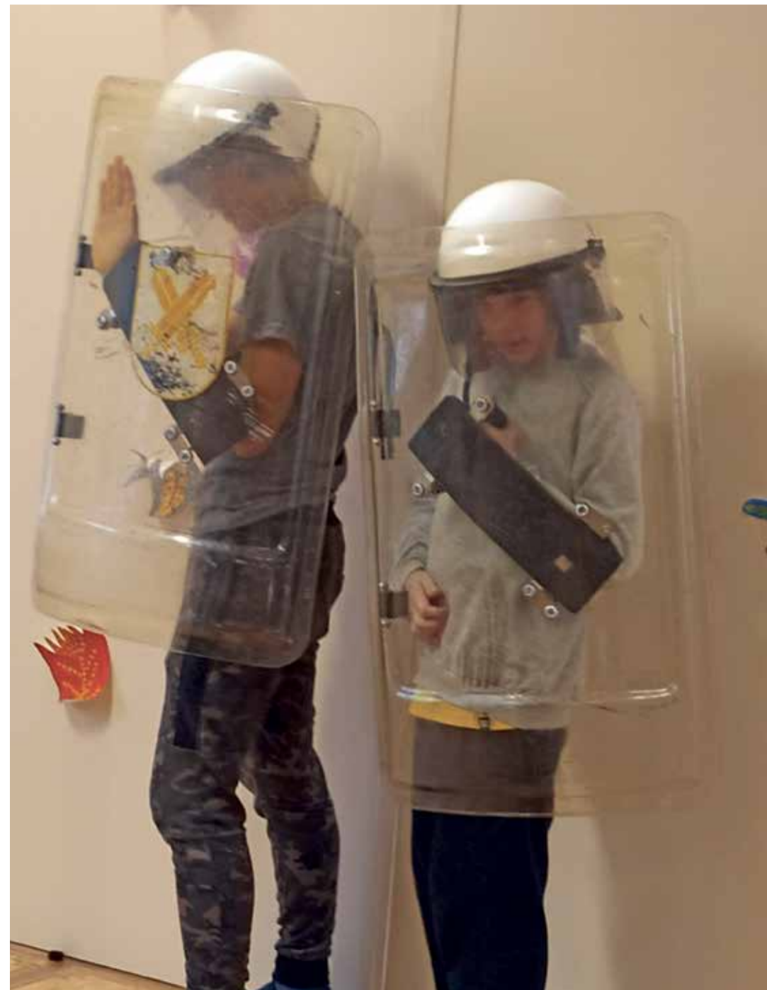
Работники музея полиции предлагали ученикам интересные занятия.