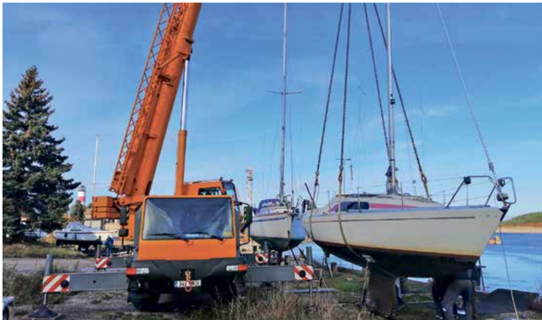
Подъем лодок на зимнюю стоянку.