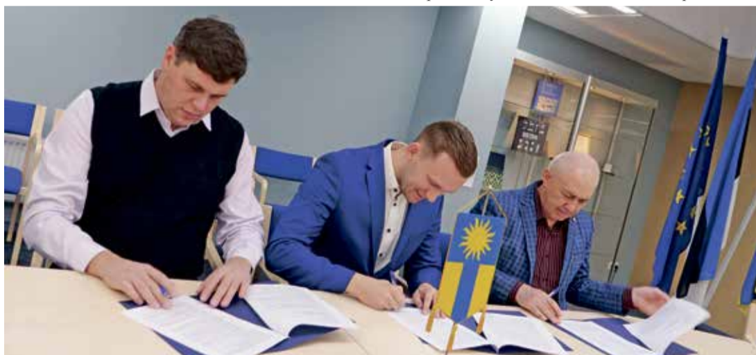
Подписание договора с представителями Jõhvi KEK OÜ и Eesti ESM OÜ.