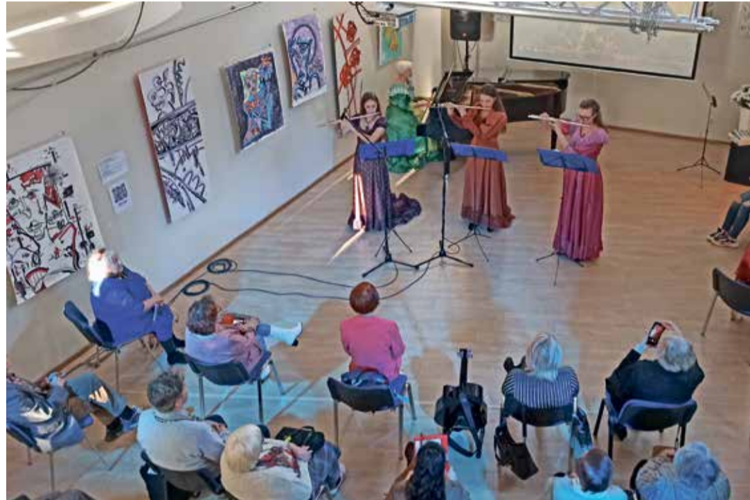
Прелестные мелодии флейты помогли создать поэтическое настроение.

Музыкальное оформление вовлекло присутствующих в единую творческую атмосферу.