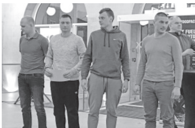
Победу на Удриа десант одержала команда из II Пярнуской дружины Кайтселийта.