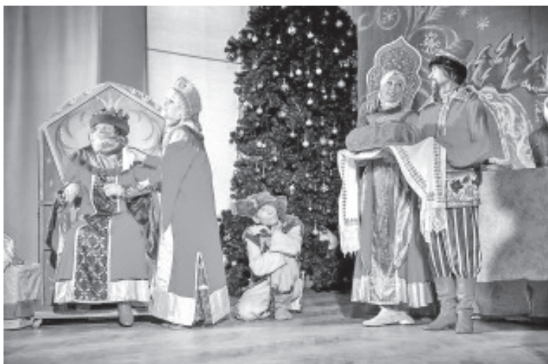
Постановка театра Туулески «По щучьему велению».

26 декабря в Народном доме Ольгина и 28 декабря в школе Синимяэ, для ребят, прошло новогоднее представление «Золушка на Новогоднем балу». С самого начала представления сказочные герои увлекли детей в волшебный мир предновогодней фантазии. Героями сказки были: Сказочница, Зимняя Фея, Золушка с Принцем, Король, Паж, Волшебник, Мачеха с дочками, Старуха Шапокляк с Атаманшей, Дед Мороз и Снегурочка. Сказочные персонажи играли с детьми в игры, водили хороводы, пели песни, а дети порадовали Деда Мороза и Снегурочку новогодними