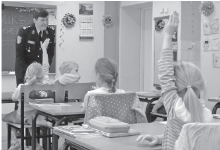
Оживленная беседа на уроке.