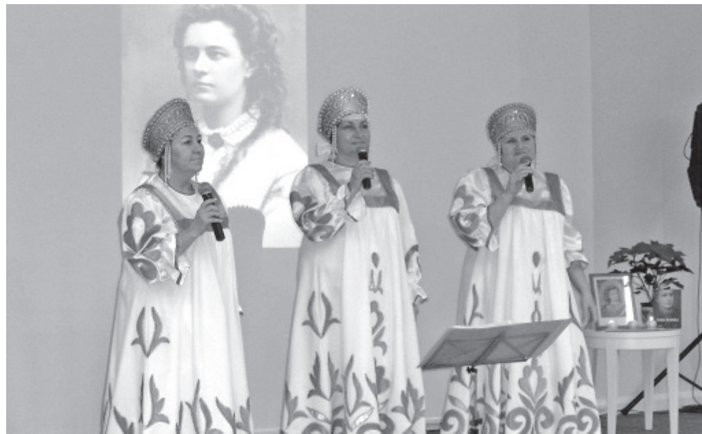
Выступает ансамбль „Надежда“

Есть на улице и свои долгожители. Это супруги - Александр Диканев прожил 100