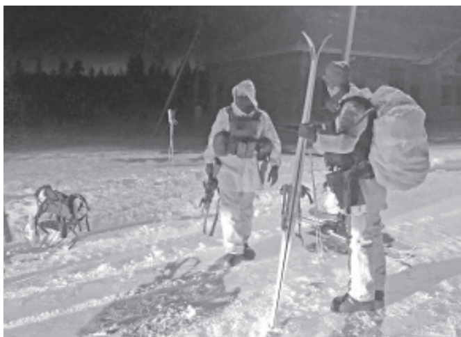
Участники Удриа десанта из Нидерландов.

Погодные условия — что в 1919, что в 2019 году — были похожими, море не было