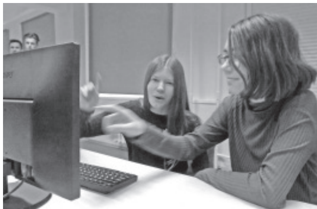
Видео-урок был интересным.

В ходе занятия учащиеся получили много интересной и важной информации. Такой формат урока был для нас новым, необычным и очень интересным. Но, как нам показалось, лучше и комфортнее себя чувствуешь все же, когда преподаватель находится в классе, так как при необходимости ему можно сразу задать