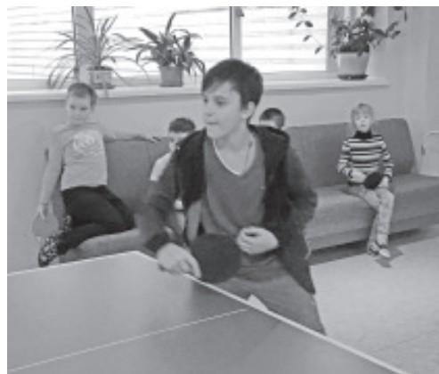
Настольный теннис приносит радость многим.

В 2017 – 2018 учебном году был проведен школьный турнир, в котором приняли участие